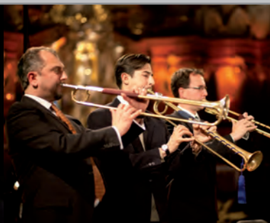
Barocktrompeten Ensemble Berlin