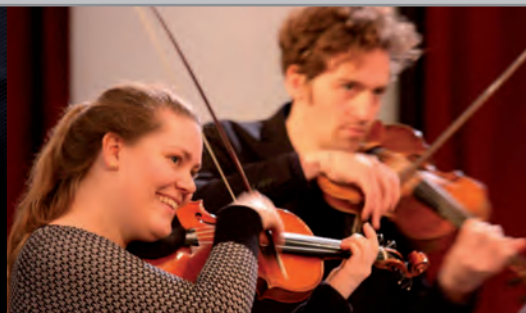
Solomon's Knot baroque collective